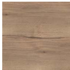
Synchronpore Eiche (se)