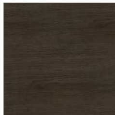
Gladstone Eiche Synchron (sg)