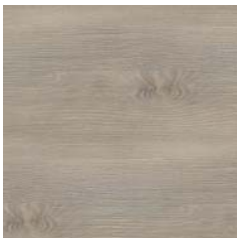
Aland Pinie Synchron (sa)