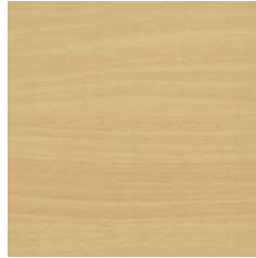
Buche Dekor hell (bh)