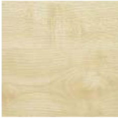
Ahorn Natur (ah)