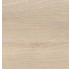
Akazie Dekor (ak)