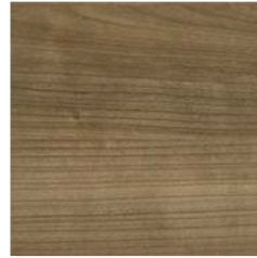
Kirschbaum Romana (ki)